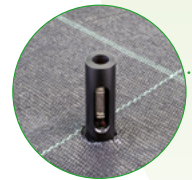
Einfach und bequem mit Wasserstandsanzeiger